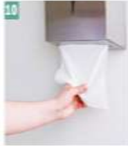
10 Kağıt havlu alınır