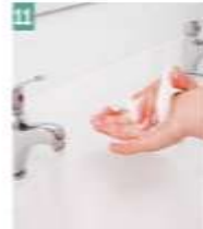
11 Eler kağıt havlu ile kurulanır