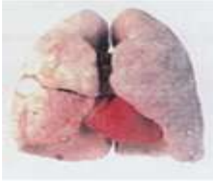
Sigara içmeyenlerin akciğerleri