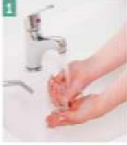
1 Eler ıslatılır