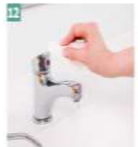
12 Musluk kağıt havlu ile kapatılır