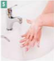
5 El sırtı ve parmak araları yıkanır