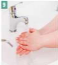
9 Eler iyice durulanır