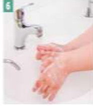
6 Başparmaklar yıkanır