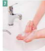
7 Parmak uçları yıkanır