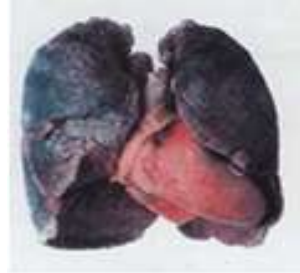
Sigara içenlerin akciğerleri