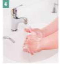
4 Avuç içi yıkanır