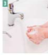
3 Eler iyice ovalanır