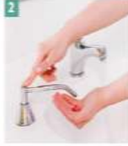
2 Sıvı sabun avuca alınır