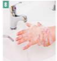
8 Bilekler yıkanır